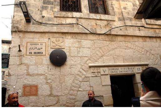
第 5 站

在第 8 站，耶稣转身对跟着他的号咷痛哭的妇女说：“不要为我哭，当为自己和自己的儿女哭。”（路 23：27 - 28）我应当为谁哭呢？为自己以往力不能胜的过犯哭泣，为我未曾得救的家人及千千万万未曾得救的灵魂哭泣。主耶稣啊，求你赦免我们的罪，饶恕我们的过犯，拯救那些未曾得救的灵魂！不是我比他们好，实在是你先爱了我，先拣选了我，求你也拯救他们！