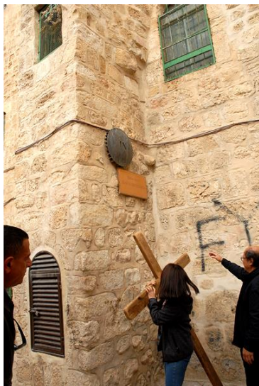
第 9 站

跌倒的耶稣爬起来时，在第 4 站遇见自己的母亲玛利亚，那该是一种何等的伤痛？肉体的伤痛还能忍受，情感的内伤何以堪！