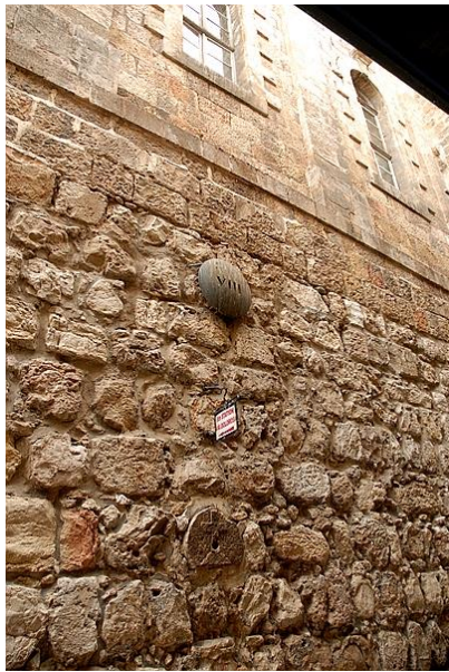
第 8 站

在第 8 站，耶稣转身对跟着他的号咷痛哭的妇女说：“不要为我哭，当为自己和自己的儿女哭。”（路 23：27 - 28）我应当为谁哭呢？为自己以往力不能胜的过犯哭泣，为我未曾得救的家人及千千万万未曾得救的灵魂哭泣。主耶稣啊，求你赦免我们的罪，饶恕我们的过犯，拯救那些未曾得救的灵魂！不是我比他们好，实在是你先爱了我，先拣选了我，求你也拯救他们！