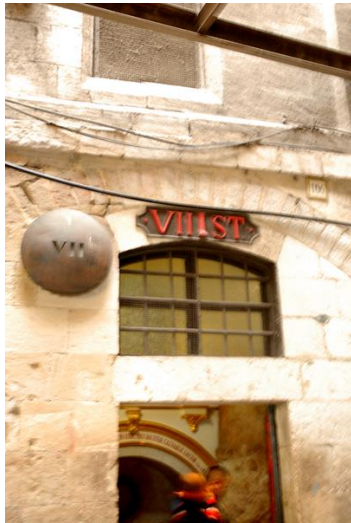
第 7 站

第 3、7、9 站分别是耶稣先后 3 次跌倒的地点。一连 7 次不合法、不合规、不合理的审讯，透支了耶稣的体力、精力，一次次的跌倒，一次次的爬起。恩主啊，在跟随你的路上，我们跌倒时，你一次次搀拉扶起，你跌倒时，何人将你搀扶？深感主恩宏厚，泪腺奔涌。