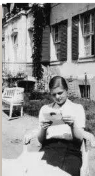
《所有美善力量》手稿