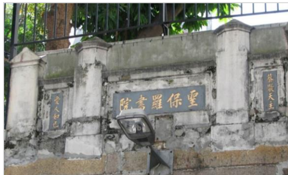
圣保罗书院（原校址）

1843 年史丹顿被任命为香港殖民地牧师，而会督府则于 1848 年建成。这里本是一所为华人而设的学校——圣保罗书院。当新的维多利亚教区成立时，史丹顿牧师将书院移交给新任命的施美夫主教，所以在 1849 - 1950 年期间，这里曾用作圣保罗书院校址。上次说过，该书院两旁的碑扁“恭敬天主”和“爱人如己”仍保留在原处。